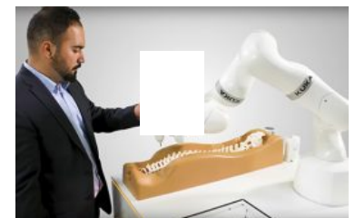
Chirurgia assistita con il robot medicale di Kuka